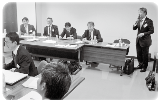
第8回講座「ケースメソッド」における模擬記者会見