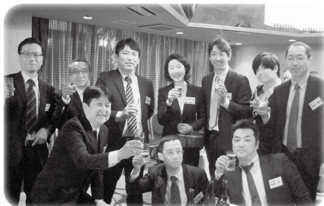
第10回最終会課題発表会後の修了懇親会